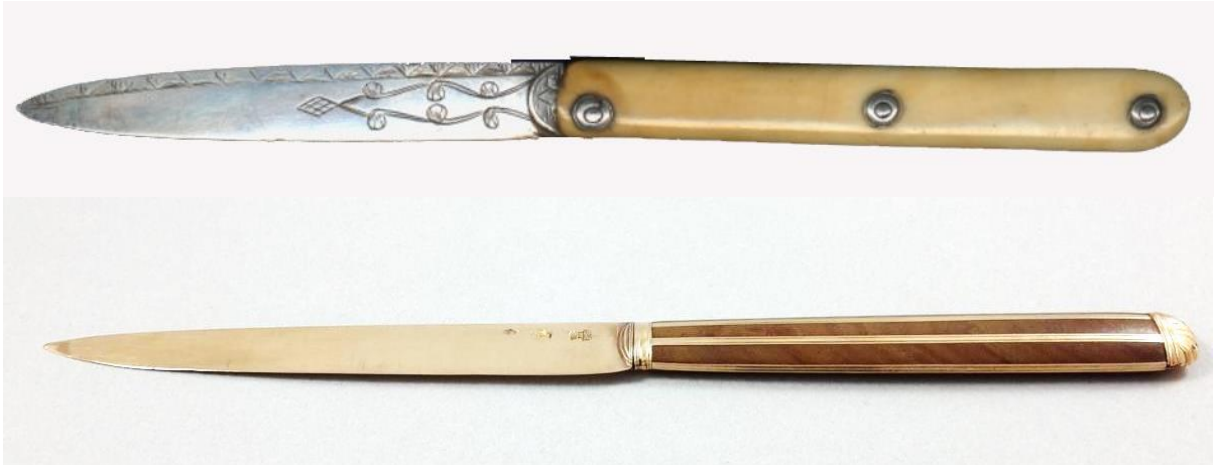
Ci-dessus deux couteaux d'époque, ci-dessous couteaux récent de bushcraft