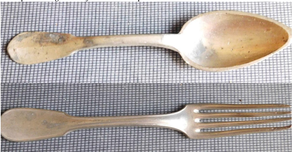
Ci-dessus couvert en étain d'époque. L'étain est facile à reconnaître il est mou.